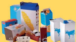
Emballages en carton et briques alimentaires bien vidés et aplatis