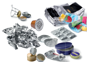
Petits emballages métalliques...