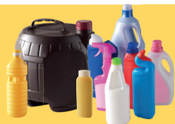
Bouteilles et flacons en plastique, alimentaire et sanitaire