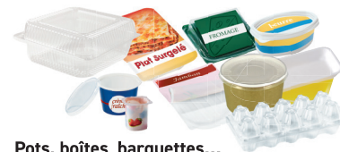
Pots, boîtes, barquettes...