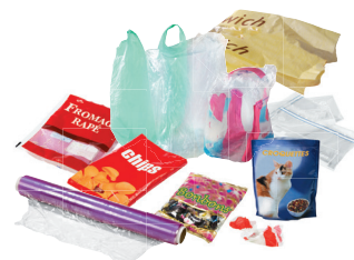
Sachets, pochettes, films plastiques...