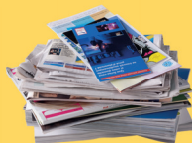
Journaux, catalogues, papiers...