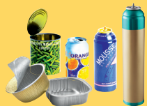
Emballages métalliques, aérosols bien vidés